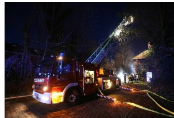
DLK23 (Atego 1529 F/Magirus, Baujahr 2010)