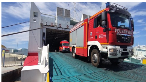
TLF3000 (MAN TGM 13.290/Ziegler, Baujahr 2011)