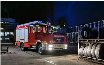
HLF20 (MAN ME 14.280/Ziegler, Baujahr 2005) In 2028 wird das neue HLF20 erwartet.

Der Löschzug Altstadt verfügt derzeit über fünf Fahrzeuge sowie fünf Anhänger.