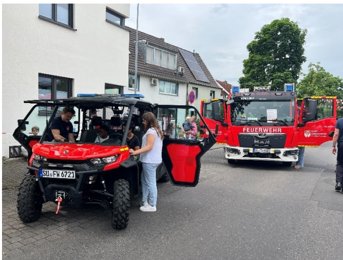
Juni 2025, Fahrzeugausstellung JF Niederdollendorf