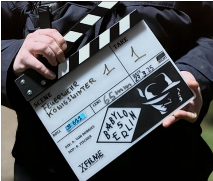
März 2025, Dreharbeiten auf Schloss Drachenburg